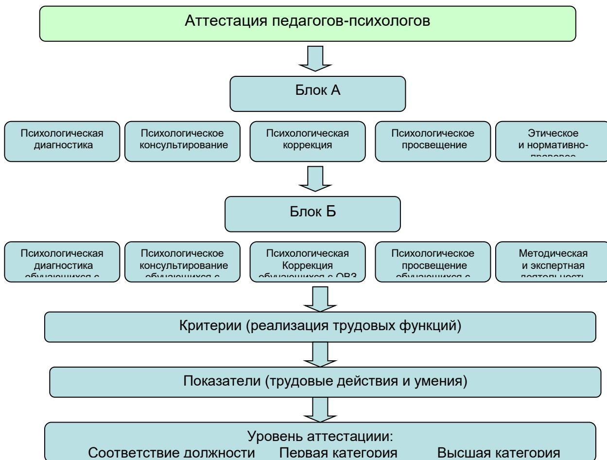
Рис.1. Критерии и показатели аттестации педагогов-психологов

Блок Б включает в себя критерии, соответствующие результативности выполнения трудовых функций, обеспечивающих психолого-профилактическую работу с обучающимися с ограниченными возможностями здоровья, испытывающим трудности в освоении основных общеобразовательных программ, развитии и социальной адаптации, в том числе несовершеннолетним обучающимся, признанным в случаях и в порядке, которые предусмотрены уголовно-процессуальным законодательством, подозреваемыми, обвиняемыми или подсудимыми по уголовному делу либо являющимся потерпевшими или свидетелями преступления. В данный блок также входят критерии, отражающие экспертную и методическую работу педагога-психолога, которая может проводиться по запросу образовательной организации.